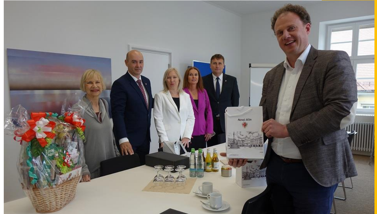
Oberbürgermeister Knecht empfängt die Delegation

Im Rahmen des Delegationsbesuchs fand zudem ein Arbeitstreffen mit der Ersten Bürgermeisterin Renate Schmetz statt, mit dem Ziel, mögliche thematische Anknüpfungspunkte in der Partnerschaftsarbeit zu besprechen.