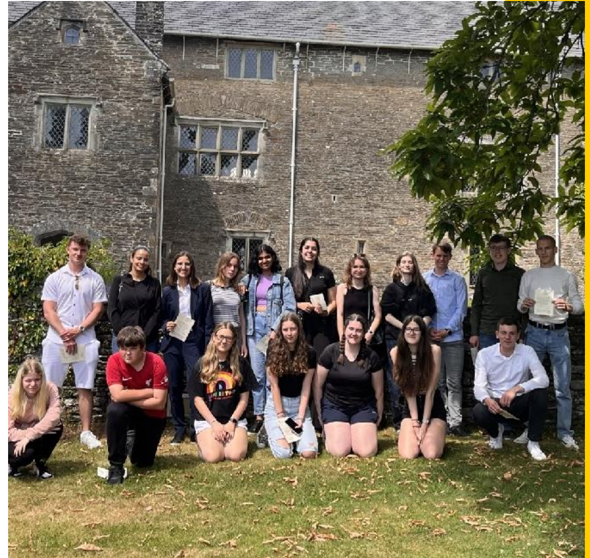
Der Jugendgemeinderat mit dem britischen Youth Council