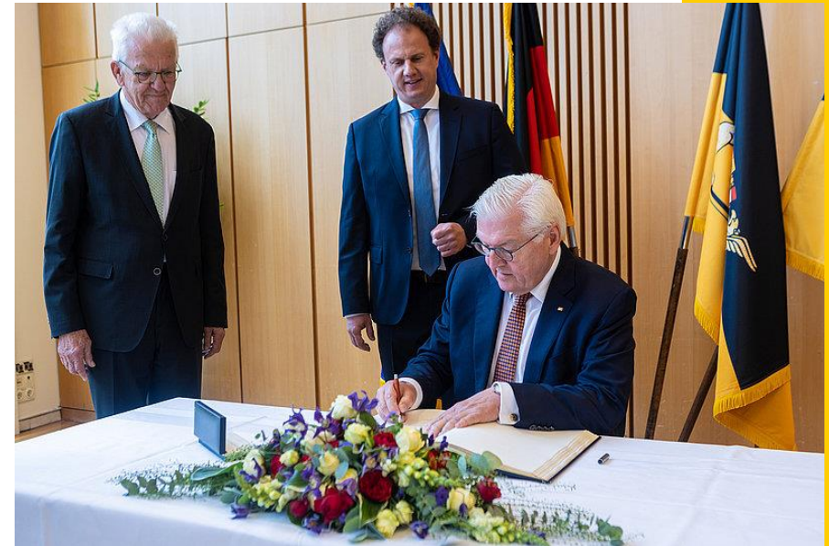
Bundespräsident Steinmeier trägt sich ins goldene Buch Ludwigsburgs ein

Das dfi organisierte zu diesem Ereignis eine "Deutsch-Französische Zukunftskonferenz". Thematisiert wurden unter anderem Herausforderungen wie der Klimawandel, Nachhaltigkeit oder der Zusammenhalt innerhalb Europas.