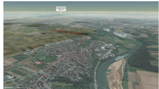
Themenweg in Stuttgart und Umgebung: Oberer Zipfelbach Video: Outdooractive, https://www.youtube.com/watch?v=epXCkBRqC8