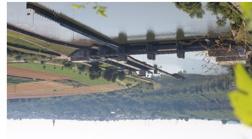
Stauwehr, Zugwiesen, Weinberge, Poppenweiler