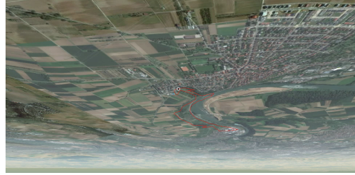
TOP Felsenrunde Art Themenweg