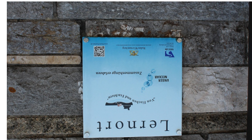
Hinweis auf Lernort auf der Stauwehr