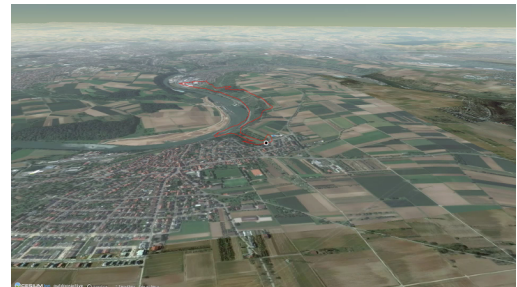
Themenweg in Stuttgart und Umgebung: Felsenrunde Video: Outdooractive, https://www.youtube.com/watch?v=i8VHPN1hTo

Spazierweg 7 von 8 im Stadtteil Poppenweiler. Entwickelt von der Bürgerschaft, den Beteiligten des Netzwerks Start der Tour Bushaltestelle/Kindergarten, Burghaldenstraße 3 Ende der Tour Bushaltestelle/Kindergarten, Burghaldenstraße 3